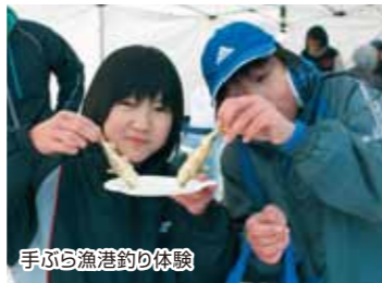
手ぶら漁港釣体験