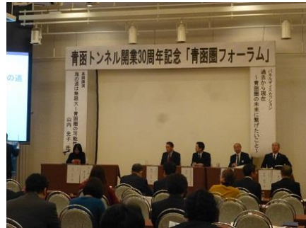
(H31.1開催 青函圏フォーラム(パネルディスカッション))

交流団体による活動事例の発表や会員からの情報提供の場を設けるとともに、フォーラム（講演会及びパネルディスカッション）を開催し、会員相互の交流・情報交換を促すことで青函圏交流・連携のプラットフォームとしての役割を担います。