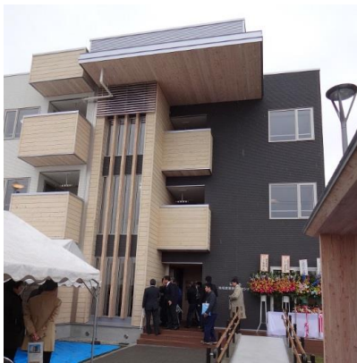
知内町地域産業担い手センター