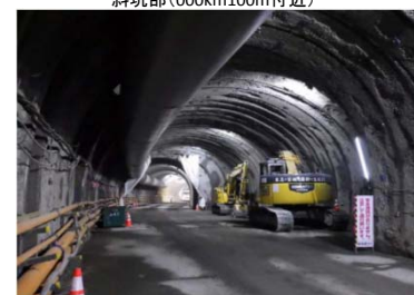
路盤の内トンネル工事進捗状況