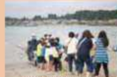
写真：地引き網体験

わくわく・どきどき体験観光！ 農産物収穫や地引き網などの体験ができます。北の大地や海の産業、自然、歴史を体感し、人と触れ合うことができる様々なプログラムをご用意しています。