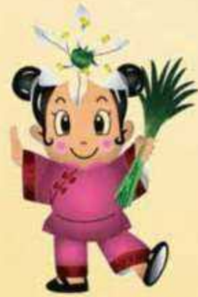
ニラちゃん（知内町）