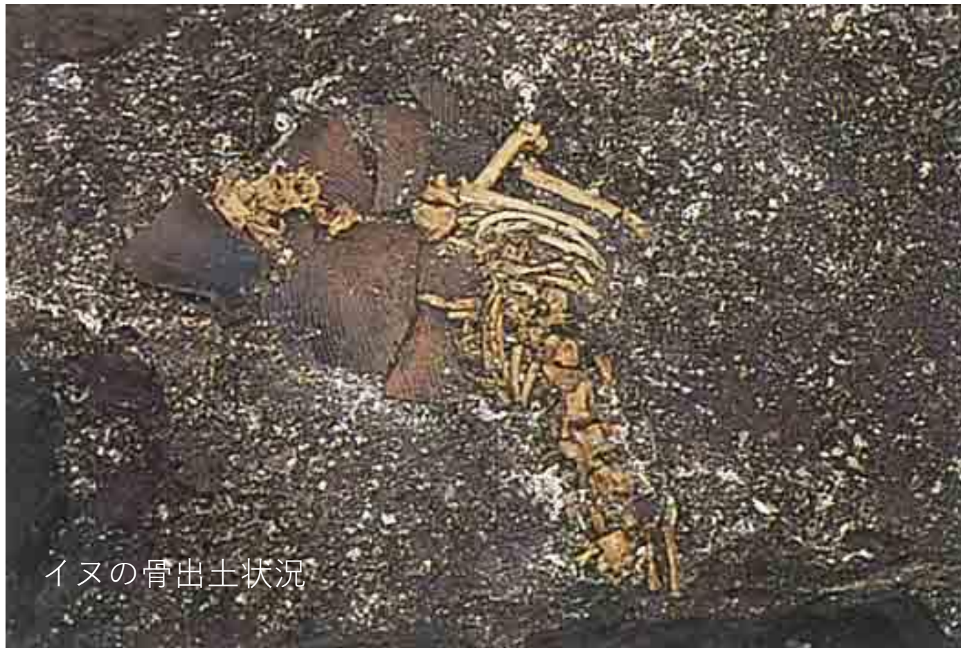
イヌの骨出土状況