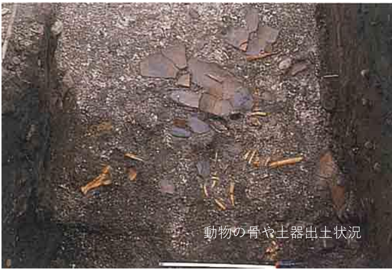
動物の骨や土器出土状況