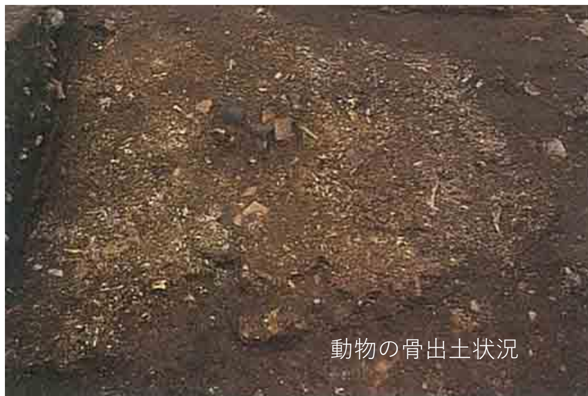
動物の骨出土状況