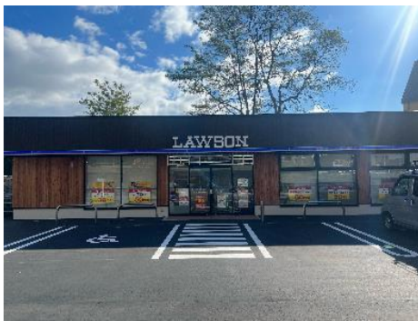
[HOKKAIDO WOOD BUILDING] ローソン函館梁川公園通店