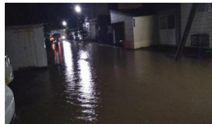
令和4年8月8日から函館市にて大雨により住宅地が冠水し住家被害が発生。

過去5カ年の災害では、令和3年8月の函館市、11月の木古内町、令和4年8月の函館市での記録的な大雨により、住家被害や農業・漁業関係などにも大きな被害が発生しています。