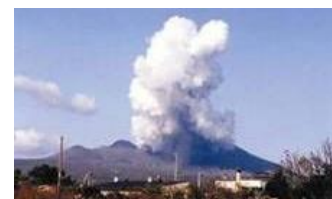
北海道駒ヶ岳の噴火