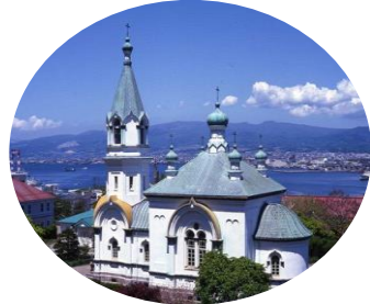
函館西部地区の街並み ＜函館市・第2回選定＞