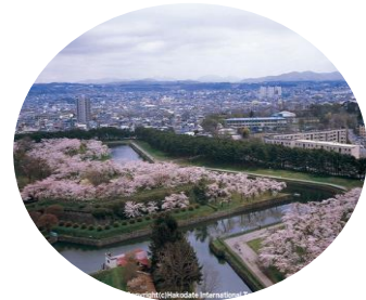
五稜郭と箱館戦争の遺構 ＜函館市など・第2回選定＞