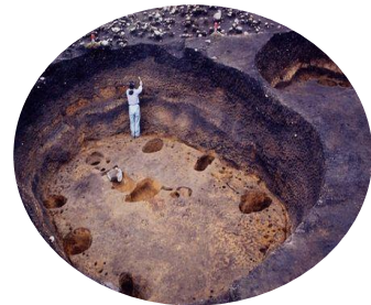
内浦湾沿岸の縄文文化遺跡群 ＜函館市など・第1回選定＞