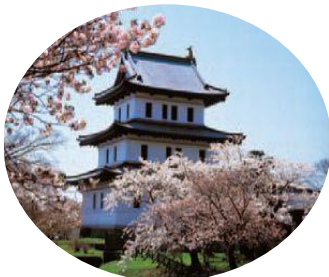
福山（松前）城と寺町 ＜松前町・第1回選定＞