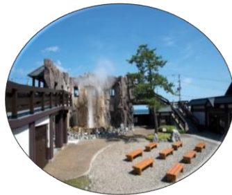
しかべ間歇泉 ＜鹿部町・第3回選定＞