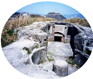
函館山と砲台跡 ＜函館市・第1回選定＞