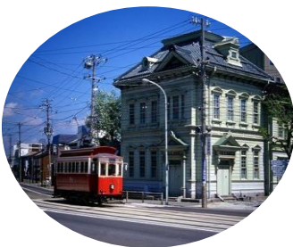
路面電車 ＜函館市など・第1回選定＞