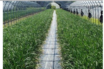
抽苔花茎除去を 丁寧に行った養成ほ場

技術実施 x：やや後手にまわっている、△：実施している、○：遅滞なく実施している にらの生育 ◎：良好、○：並(草丈、茎径、SPADを参考に観察をもって評価)