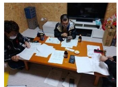
討論形式の学習会