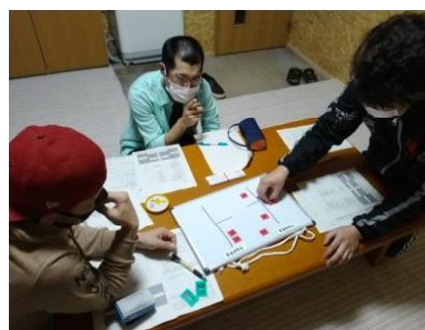
マグネットボードを用いた演習