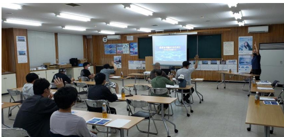
JA青年部・南渡島4Hクラブ合同勉強会