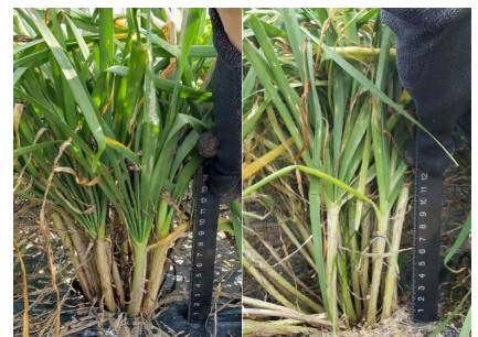
左の株は太く葉数が多い(A氏)

①担い手の経営管理能力の向上：戸別経営判断手法の習得 (3人中3人：到達度100%)