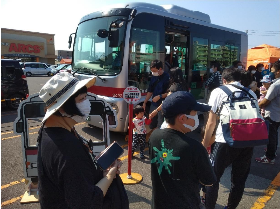
図 7-11 函館市内ショッピングモールにおける函館バスフェスティバル（函館バス（株））