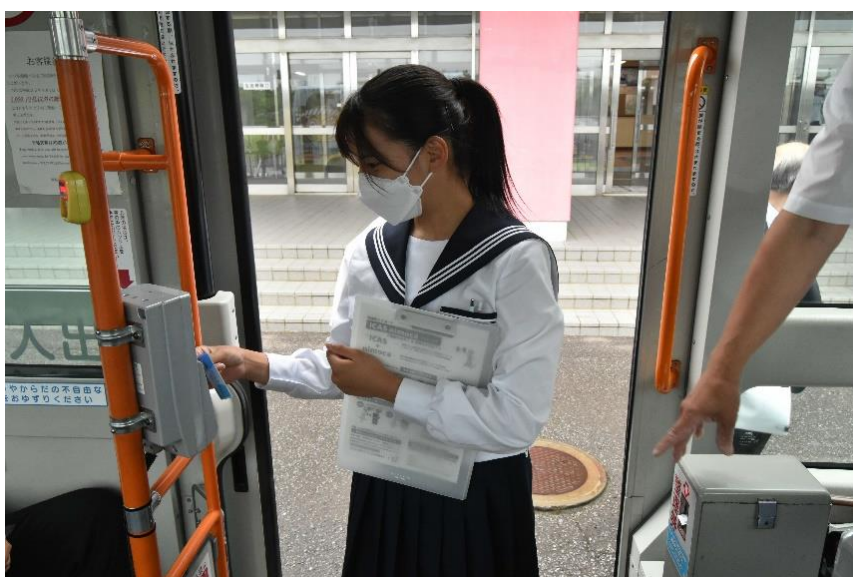
図 7-10 北海道江差高等学校における乗車体験（函館バス(株)）

学校やイベント会場において、乗車体験の実施や、ICカードの利用など便利な乗車方法について学習機会を設けるなど、公共交通に慣れ親しみ、利用に繋げる取組を実施する。