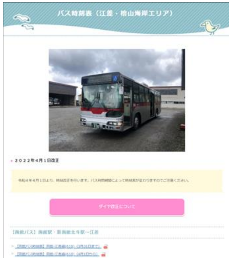
図 7-9 町ホームページにおける運行ダイヤ提供（江差町）