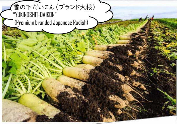
雪の下だいこん (ブランド大根) "YUKINDOSHIT-DAIKON" (Premium branded Japanese Radish)