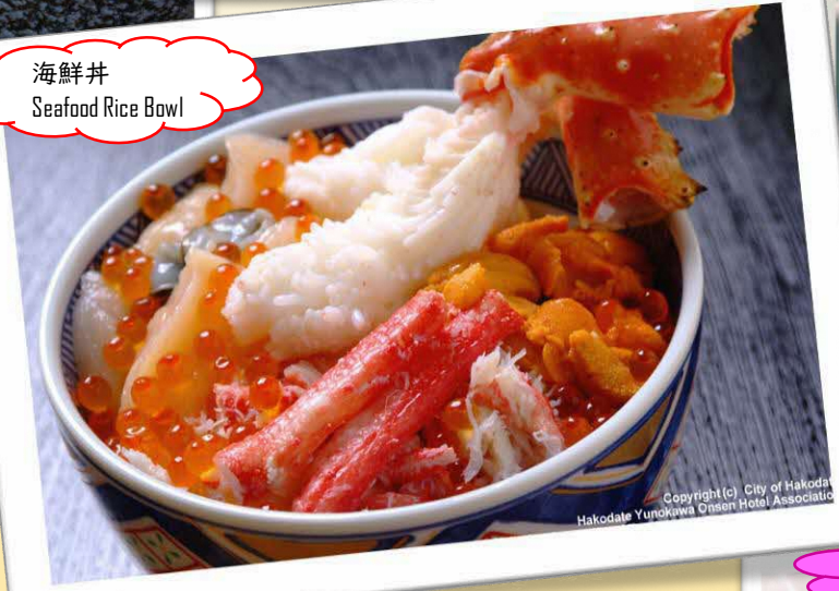
海鮮丼 Seafood Rice Bowl