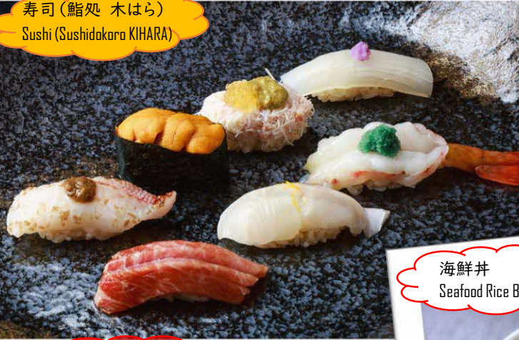
寿司 (鮭処 木はら) Sushi (Sushidokoro KIHARA)