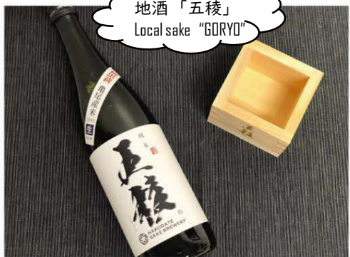
地酒「五稜」 Local sake "GORYO"