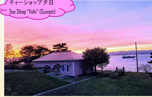
ティーショップ夕日 Tea Shop "Yuhi" (Sunset)