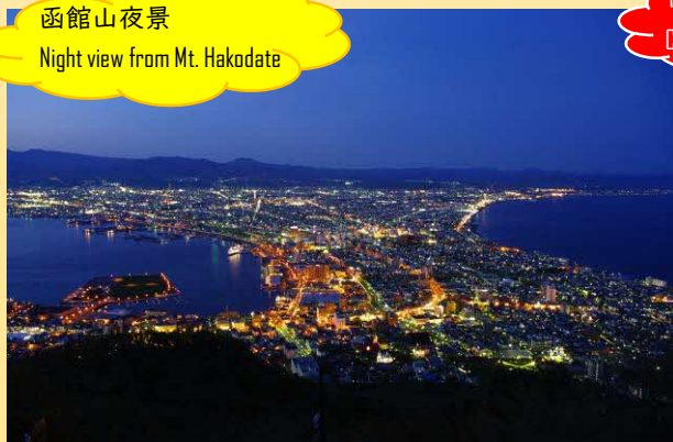
函館山夜景 Night view from Mt. Hakodate