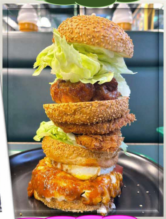
地元ハンバーガー店 ラッキーピエロ Hakodate Local Hamburger Shop "LUCKY PIERROT"