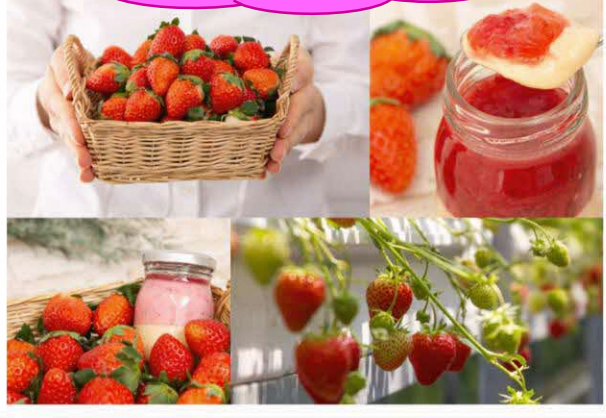
はこだて恋いちご (ブランドいちご) "Hakodate KOI Ichigo" (Premium branded strawberry)