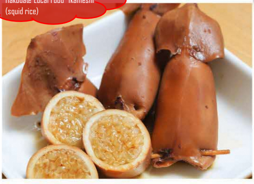
地元フード「いかめし」 Hakodate Local Food "Ikameshi" (squid rice)