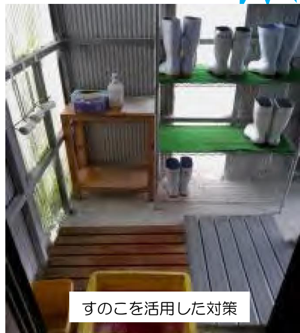
すのこを活用した対策