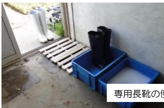
専用長靴の使用と消毒