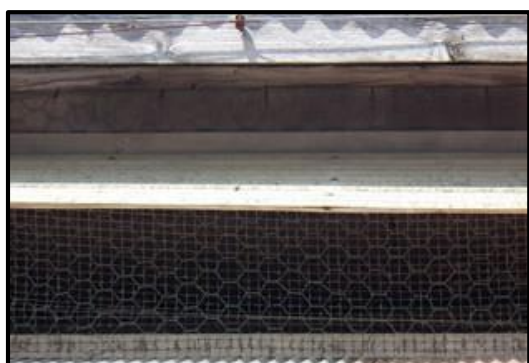
換気口のネット設置