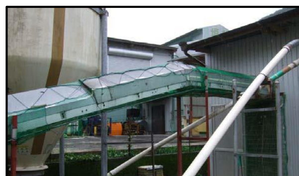
鶏糞搬出口のネット設置

10月から5月までの期間は、毎月、飼養衛生管理者による自己点検を実施してください。