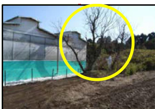
家きん舎周囲の 樹木の剪定