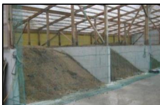
堆肥舎のネット設置