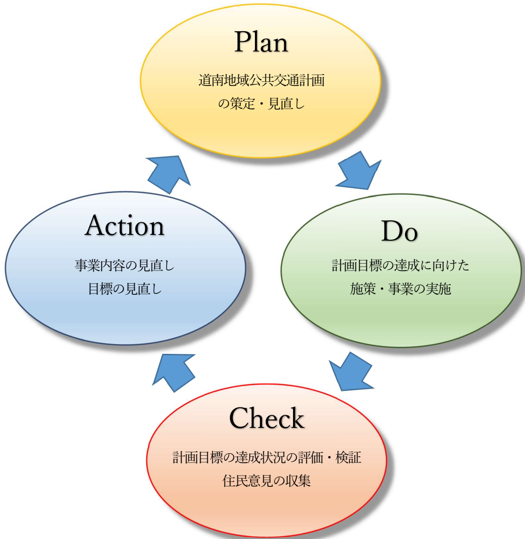
図 8-1 本計画の推進におけるPDCAサイクル

本地域の地域公共交通を取り巻く環境の変化に的確に対応できるよう、計画はPDCAサイクルのもと推進するが、そのサイクルの一環として、目標達成状況のモニタリングと評価を実施し、その結果を踏まえ、事業の見直しや目標の見直しを検討する。