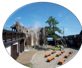
しかべ間歇泉 ＜鹿部町・第3回選定＞