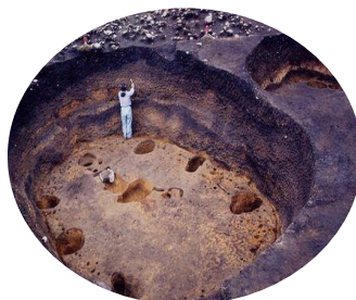
内浦湾沿岸の縄文文化遺跡群 ＜函館市など・第1回選定＞