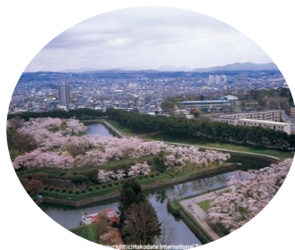
五稜郭と箱館戦争の遺構 ＜函館市など・第2回選定＞