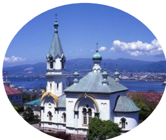
函館西部地区の街並み ＜函館市・第2回選定＞