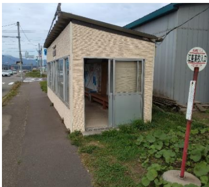
図 7-3 デマンド型交通と路線バスの乗換地点における待合環境の整備 （「熊石」バス停）（八雲町）