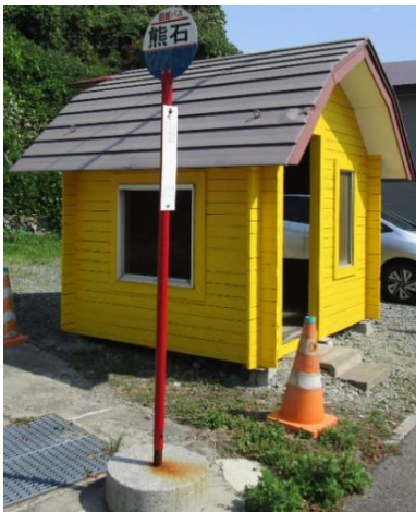
(左) 天候が悪い時にも快適にバスを待つことができるよう、八雲町が小屋式の待合所を整備