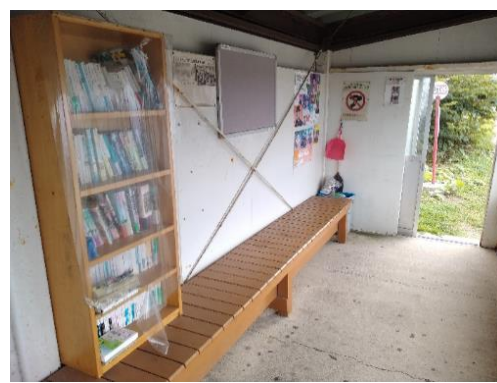
図 7-4 「無人図書館」のあるバス待合所（「江差高校入口」バス停）（江差町）